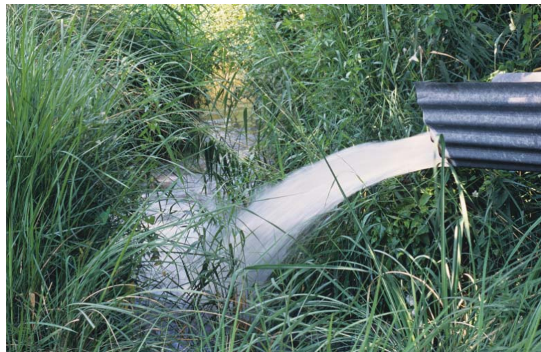
Ποταμός Σπερχειός, Διοχέτευση νερού σε κανάλι