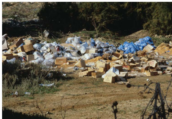
Ποταμός Γαλλικός, απόθεση σκουπιδιών κοντά στην κοίτη του ποταμού

τουργεί σχετική ομάδα εργασίας με όλους τους εμπλεκόμενους φορείς).